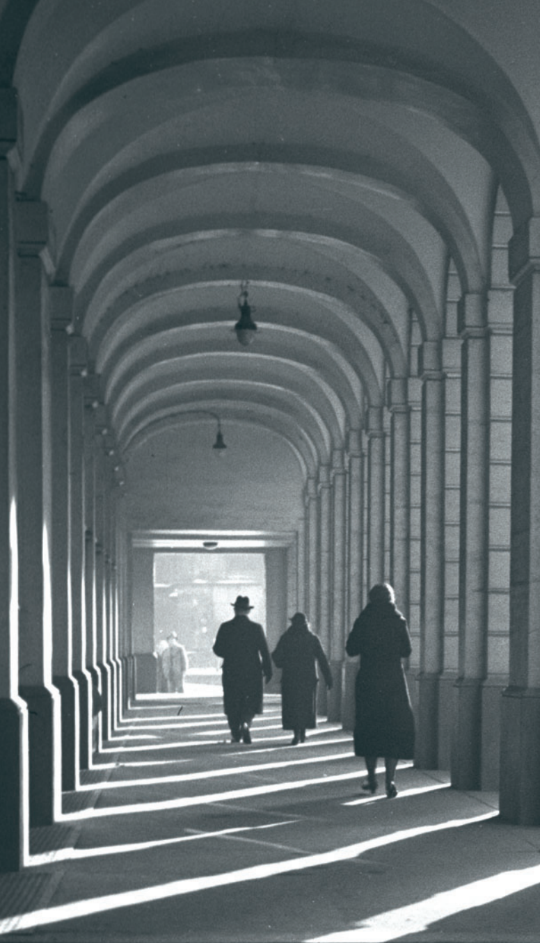
In den Rathausarkaden, Foto von Hermann Brösel, um 1930 © Stadtarchiv Magdeburg, Fotosammlung Brösel Album III 13 3'